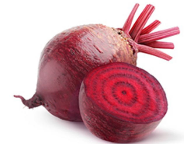
Rote Bete ( beetroot)