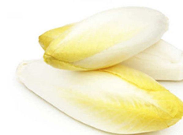
Chicorée ( chicory)