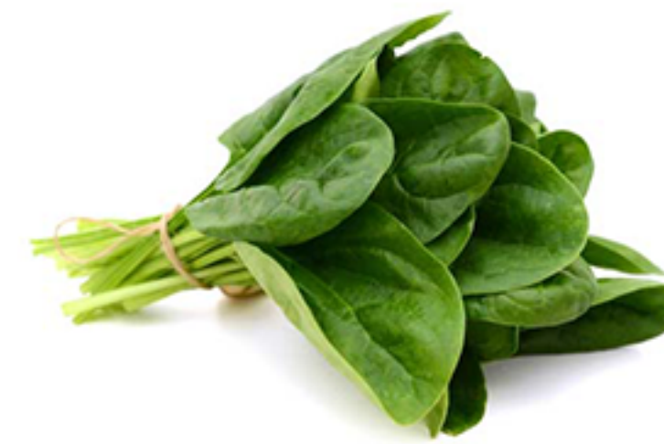
Spinat ( spinach)