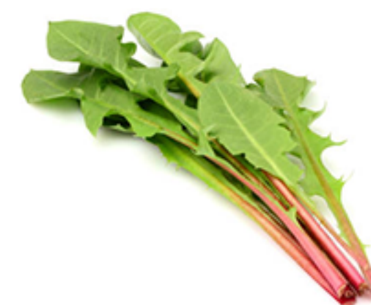
Löwenzahn ( dandelion)