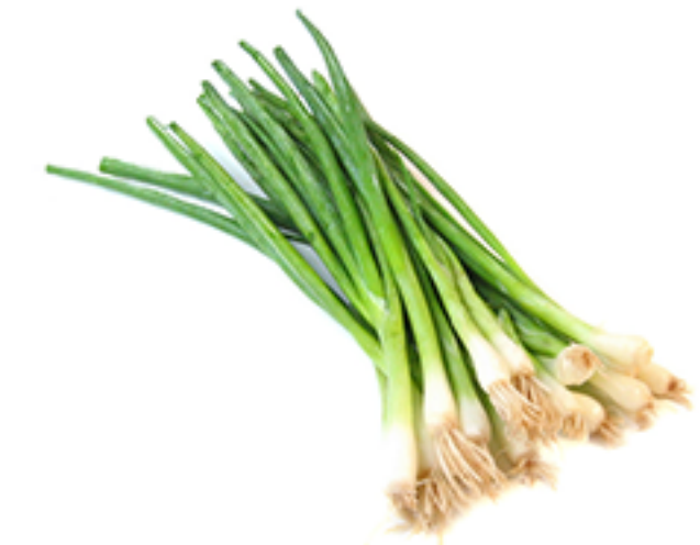
Lauch ( green onion)