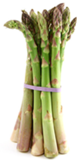
Spargel ( asparagus)