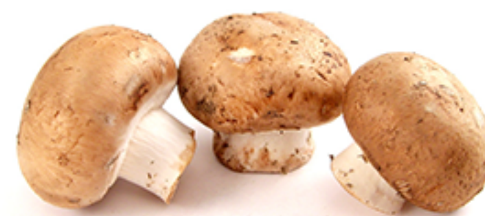
Champignon ( mushroom)